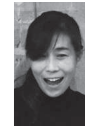
Sasa/Marie (サインミュージック)