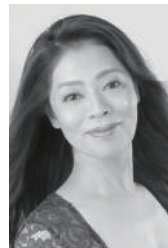
清水理恵 (ソプラノ)