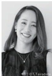
篠原悠那 (ヴァイオリン)